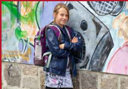
Eine ganz tolle Erfahrung, dass jemand stolz auf den Schulabschluss ist.