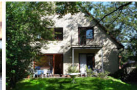
Ehem. Wohnhaus Seekamp