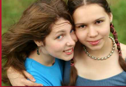
Schwesterliche Solidarität half in teilweise dramatischen Situationen.