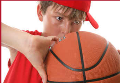
Der Traum, in der NBA zu spielen, ist bis heute aktuell.